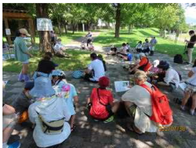
いきものの観察・説明・水質検査